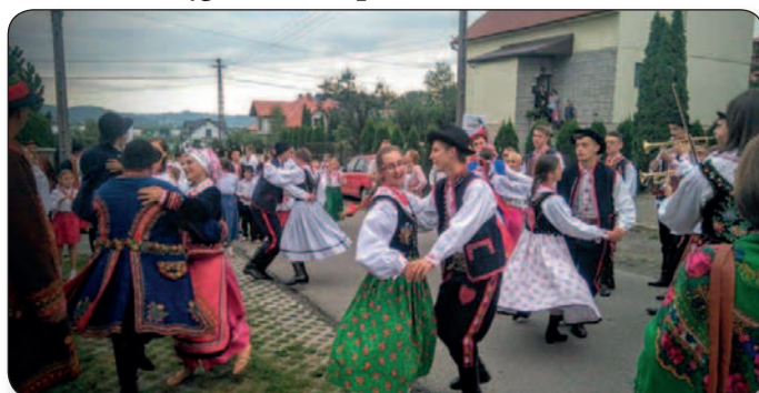
Tęgoborskie Spotkanie z Folklorem