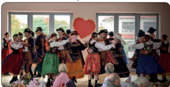
Gminny Dzień Seniora