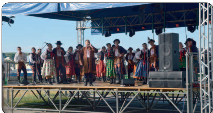
Letni Folklor z Jakubkami