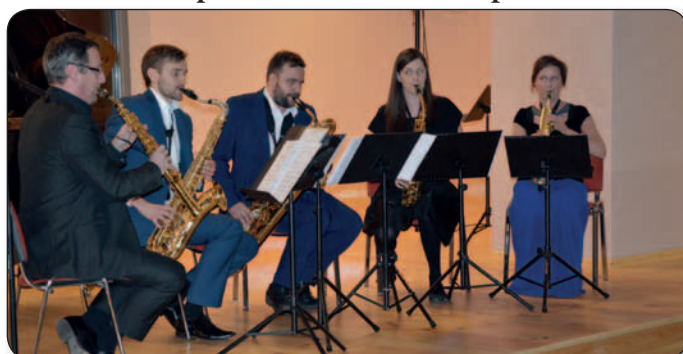
Małopolski Festiwal im. Adolpha Saxa